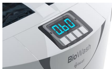
Total control en los periodos de limpieza