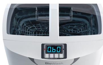
Facilita la remoción de residuos